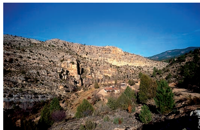
Refugio Molino Cuchillos, Ademuz