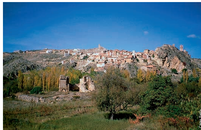
Castielfabib y las ruinas de San Guillermo